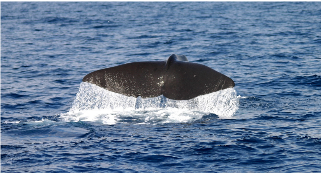
Pottwal ( Physeter macrocephalus ) beim Abtauchen.

DEM FORSCHUNGSPROJEKT VON OCEANCARE ÜBER DIE ZEITLICHE & ÖRTLICHE VERBREITUNG VON WALEN & DELPHINEN IM NORDWESTLICHEN MITTELMEER