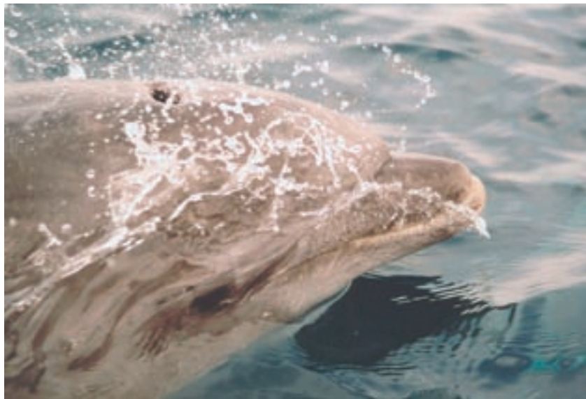
Abb. 6: Grosser Tümmler

Ein europäisches Whale Watching Label, welches von allen Akteuren gemeinsam entwickelt und getragen wird, könnte diesen Anforderungen gerecht werden und einen soliden, internationalen Whale Watching Standard setzen sowie Cetaceen-verträgliches Verhalten fördern.