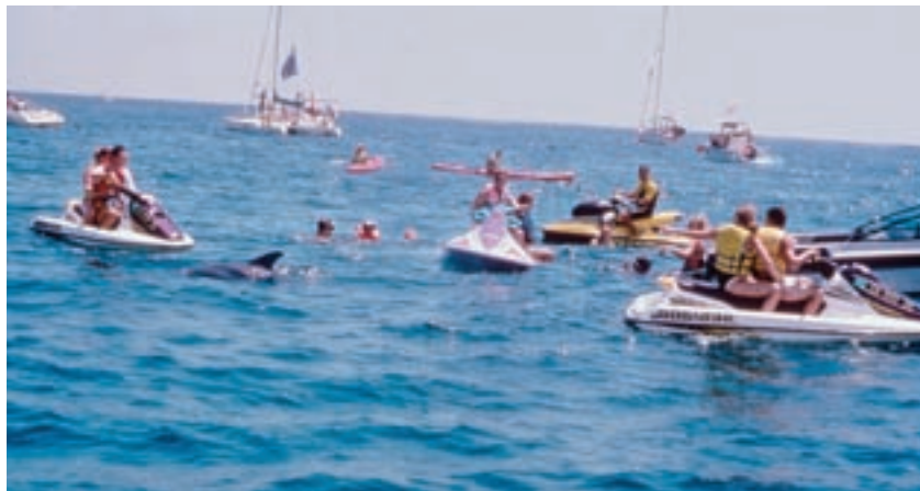
Abb. 4: Whale Watching Chaos

«On occasion dolphins seem willing to include us in their play behaviour, but we should not assume that they are there to entertain us. Unfortunately, we have also observed some interactions between humans and dolphins that have resulted in harassment. People leap off the side of their boat directly on top of dolphins, lunge for them as they swim past, and drive at high-speed in circles in an attempt to get them to jump. Many times people do not realize that their misguided efforts to interact with the dolphins are either dangerous or disturbing to the animals.» (Constantine & Yin, 2003, S. 260)