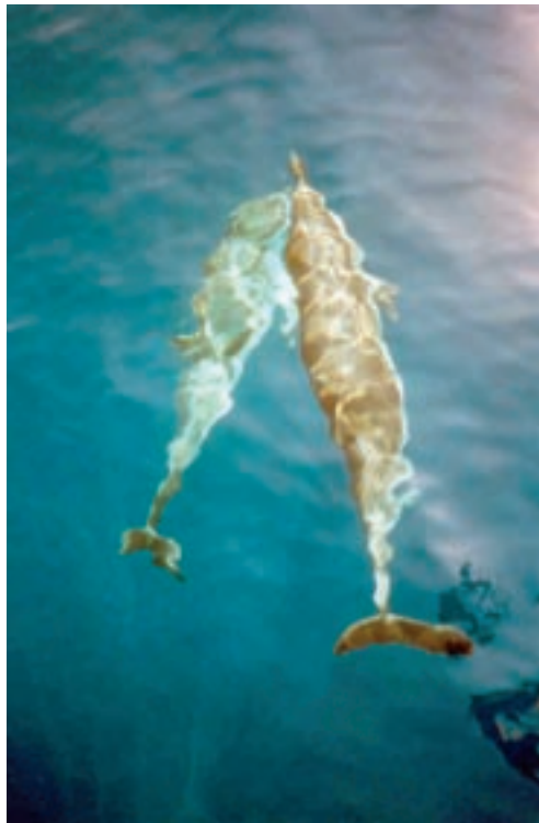
Abb. 1: Blau-Weisse Delphine im Mittelmeer

Die notwendigen Informationen wurden vornehmlich mittels Literaturarbeit zusammengestellt. Eigene Erfahrungen und Eindrücke aus der Praxis sind jedoch auch in die Arbeit eingeflossen, welche innerhalb des ASMS Walforschungsprojektes im Mittelmeer 3 und während ausgewählter Aufenthalte an spezifischen Whale Watching Orten gemacht werden konnten.