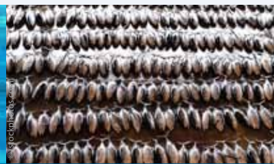
Ungebremst rotet unsere Sushi-Begeisterung den Blauflossen-Thunfisch aus.