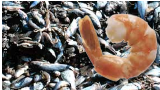
1 Kilo Crevetten = bis 20 Kilo Beifang – eine absurde Bilanz, die nur wir als Konsumenten ändern können.

Je nach Art und Fangtechnik wiegt ein Kilo Speisefisch aus dem Meer unter Berücksichtigung des Beifangs in Realität sehr viel mehr: Auf 1 Kilo Seezunge kommen beispielsweise 13 Kilo Beifang. Besonders negativ ist die Bilanz bei Crevetten sowie bei Fischen wie Rotbarsch und Goldbutt, die am Meeresgrund leben und mit Schleppnetzen gefangen werden.